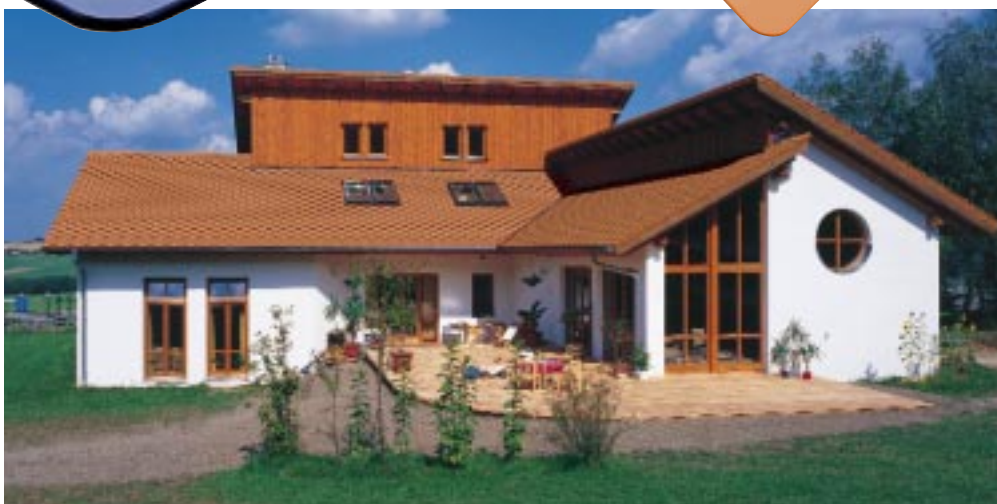
Einfamilienhaus in Neukirchen, gedeckt mit dem Rautenziegel Smaragd.

Exklusive Formgebung: Der Rautenziegel Smaragd