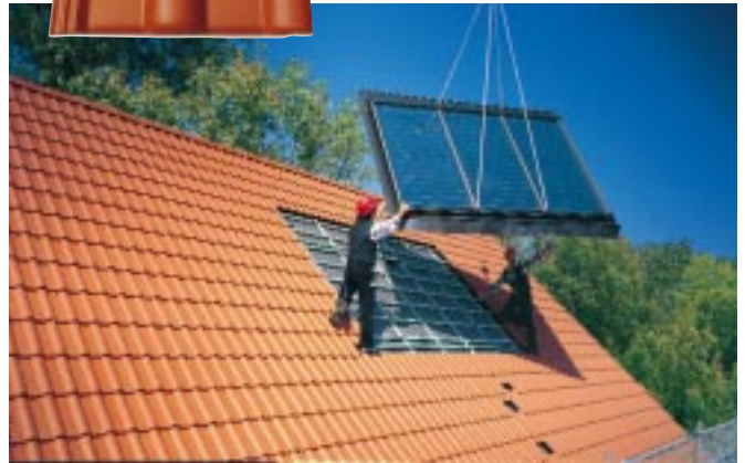
Mit den Braas Solarsystemen wird die Globalstrahlung der Sonne besonders effektiv genutzt: Das Bild zeigt die Montage eines Thermokollektors zur Warmwasser-Erzeugung, der mittels Kran in ein Braas Dach eingesetzt wird.

Neu: Die bewährte Frankfurter Pfanne Seidenglanz mit der speziellen, Schmutz abweisenden Oberfläche in „Star“-Technologie. Dabei werden Schmutz- und Staubpartikel aus der Atmosphäre weitgehend mit dem Regenwasser abgespült.