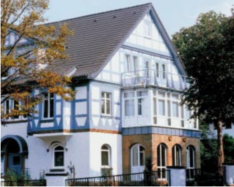
Das Ergebnis einer fachgerechten Renovierung ist oft kaum vorstellbar. Das formal und farblich fein auf das Fachwerk und die Fassade abgestimmte Dach mit Braas Doppel-S trägt entscheidend dazu bei.

verständliche Grundvoraussetzung für jedes Unternehmen sein. Hinzu kommen die kompetente Beratung durch den Baustoff-Fachhändler und die fachgerechte Verlegung des Verarbeiters, die vom Kunden ebenfalls vorausgesetzt werden. Doch wie der Hersteller-Service auch Jahre nach einem realisierten Auftrag noch uneingeschränkt zur Verfügung steht, wurde für die Phase davor der Braas DachKredit geschaffen. Wie der Erfolg in den drei Jahren seines Bestehens zeigt, ist dieser Finanzierungs-Service ein probates Mittel für den Verarbeiter, den Auftragsabschluss zu forcieren. Dank einer Finanzierung mit äußerst günstigen Konditionen scheitern notwendige Dachsanierungsarbeiten nicht mehr am Budget des Bauherrn. Oder er schont seine Rücklagen.