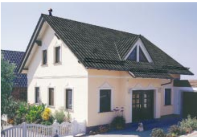
Das Visualisierungsprogramm FotoPlus vermittelt dem Kunden bzw. Bauherrn bereits im Vorfeld einer geplanten Dachsanierung einen realistischen Eindruck des neuen Daches.